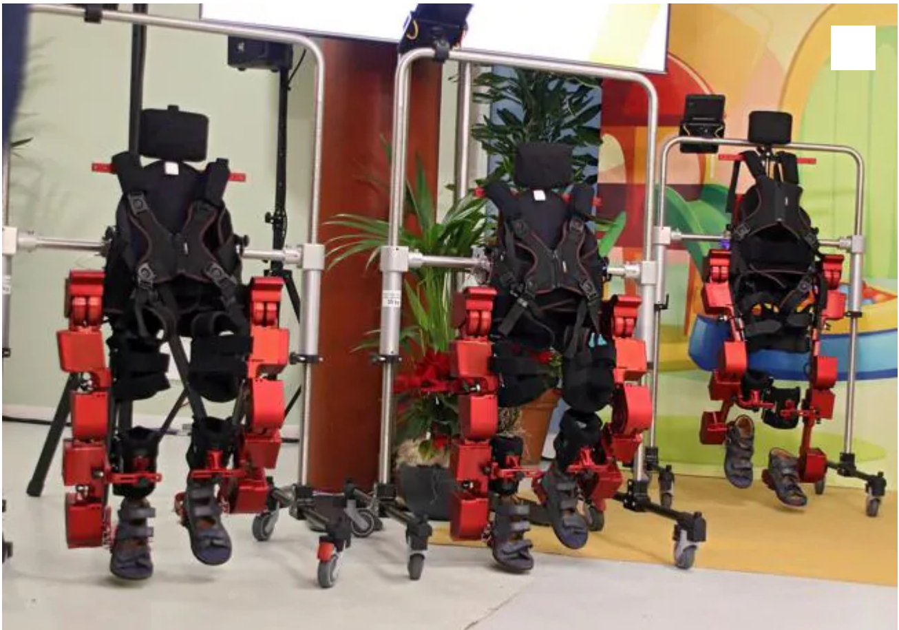
El presidente de la Junta participa en la presentación del 'Exoesqueleto Pediátrico, Atlas 2030' en León.