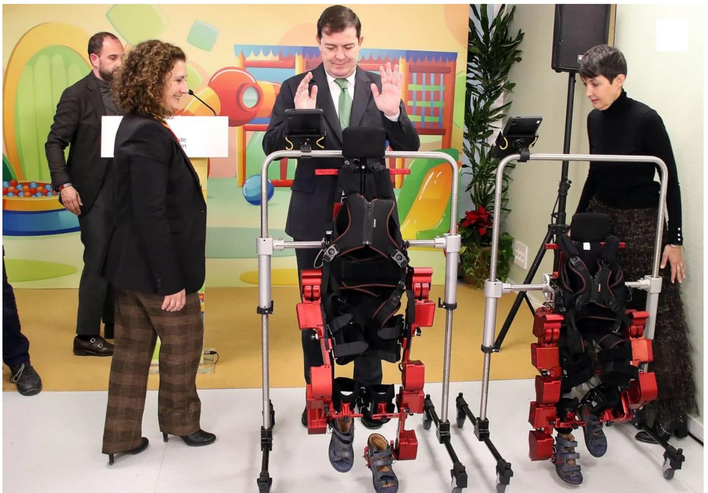
El presidente de la Junta participa en la presentación del 'Exoesqueleto Pediátrico, Atlas 2030' en León. Peio García

Mañueco anuncia la compra para el Caule de un nuevo secuenciador masivo y la puesta en marcha de una nueva sala blanca de farmacia con una inversión cercana a los dos millones de euros