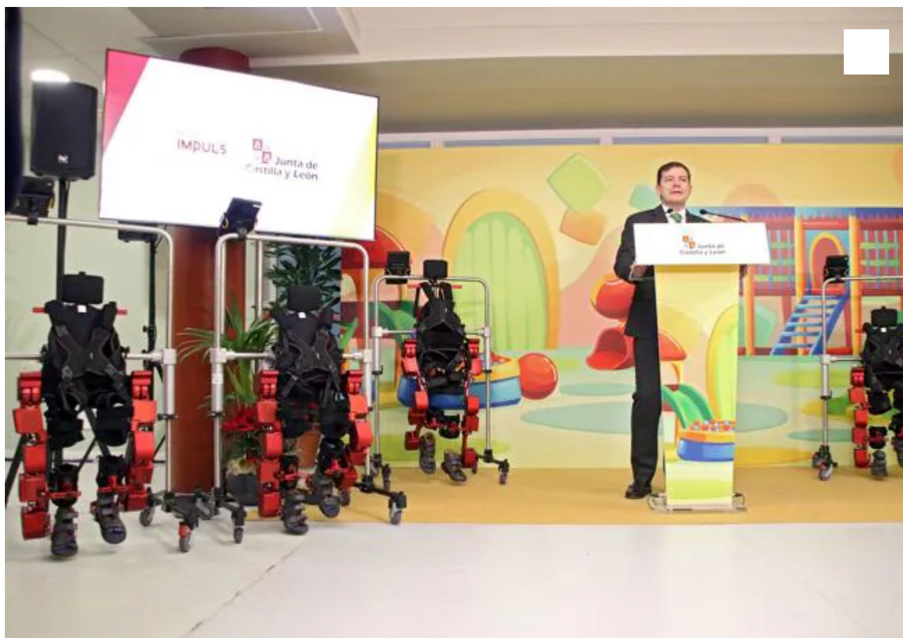
El presidente de la Junta participa en la presentación del 'Exoesqueleto Pediátrico, Atlas 2030' en León.

Asimismo, el presidente aludió al Instituto Biosanitario de León, que en estos momentos «investiga cómo utilizar la inteligencia artificial para mejorar los tratamientos en los pacientes oncohematológicos», para lo que una simulación «permitirá evitar urgencias en la evolución del tratamiento», lo que hará que este «sea más personalizado» y que, en definitiva, «se trate mejor a los enfermos».