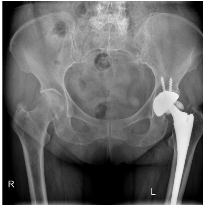
Figura 1: Rx simple AP: prótesis total de cadera izquierda por cerámica-cerámica donde se observa rotura de la cabeza de cerámica.