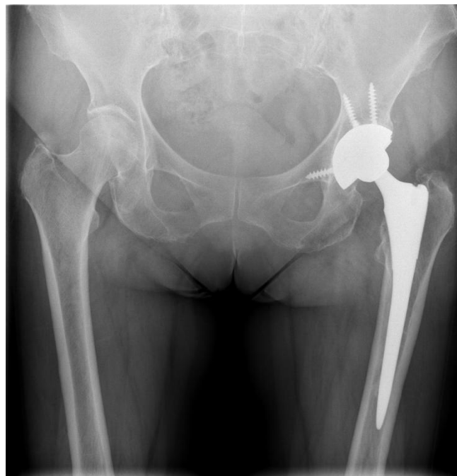
Figura 2: Rx simple AP de la primera cirugía de recambio con un cotilo de tantalio (par metal-polietileno)