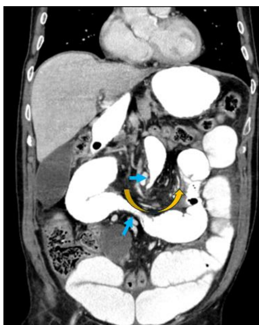
Imagen 4: TC de abdomen y pelvis con contraste intravenoso y oral, reconstrucción coronal. Presenta el signo del remolino (flecha naranja), en el cual se observa una disposición arremolinada del mesenterio y sus vasos alrededor del punto de torsión. Además, se visualizan dos puntos de cambio de calibre (flechas celestes), en relación con obstrucción en asa cerrada. Servicio de Radiodiagnóstico Complejo Asistencial de Zamora.