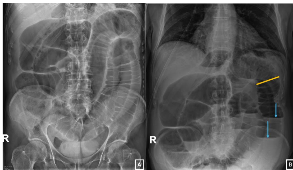
Imagen 1: 1A, radiografía abdominal AP en decúbito que muestra dilatación de asas de intestino delgado (con válvulas conniventes). 1B, radiografía abdominal en bipedestación que muestra dilatación proximal del intestino delgado, con un diámetro transversal > 3 cm (línea naranja) y asas intestinales distales no dilatadas. Se observan niveles hidroaéreos (flechas celestes). Servicio de Radiodiagnóstico Complejo Asistencial de Zamora.